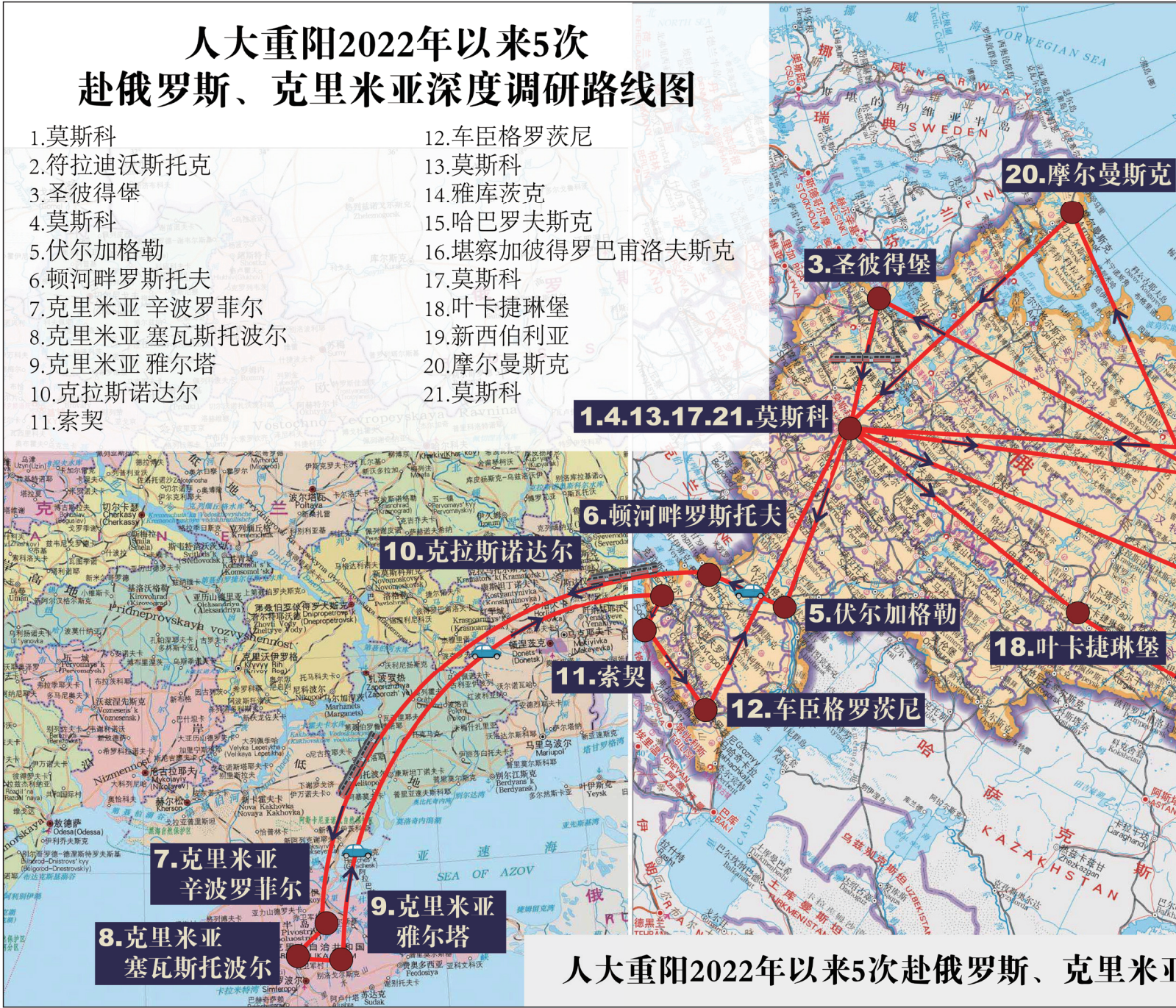
人大重阳2022年以来5次赴俄罗斯、克里米亚